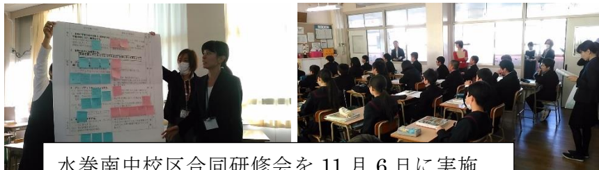
水巻南中校区合同研修会を11月6日に実施

柱Ⅰ 「日常」の授業変革 柱Ⅱ 「必要感」のある学校間の連携・協働 柱Ⅲ 「熟議」と「当事者意識」のある 学校・行政・家庭・地域の連携・協働・信頼構築