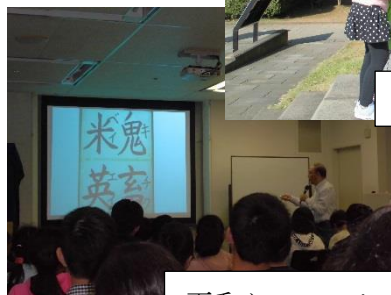
平和についての講話